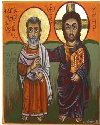
Der Hl. Menas mit einem „Denkzettel“ in der Hand von Christus, dem Wort, umarmt (koptische Ikone, 6. Jhd.).